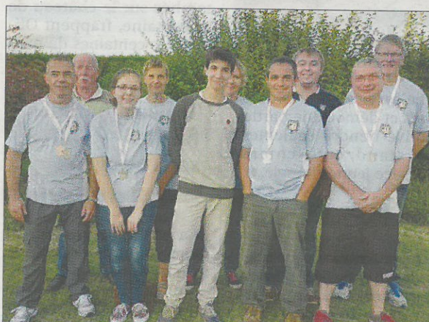
CHAMPIONNATS. Les médaillés sont heureux de leurs performances.

- Championnats de France Ufolep à Issoudin les 8 et 9 mars : deux qualifiés en arbalète, un en