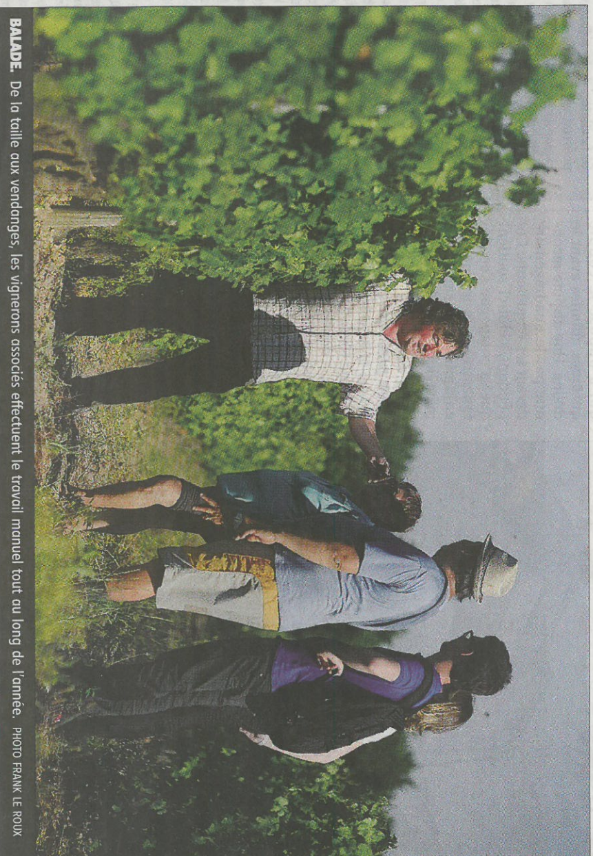
BALADE. De la taille aux vendanges, les vignerons associés effectuent le travail manuel tout au long de l'année.

sept hectares de vignes en production, conduites en agriculture biologique. Il exploite trois cépages : le